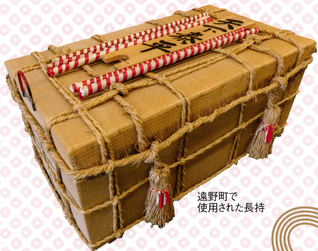
遠野町で使用された長持