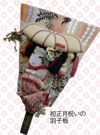
初正月祝いの羽子板