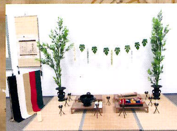
安藤家の七夕飾り [4月29日(土)~5月29日(月)展示予定]