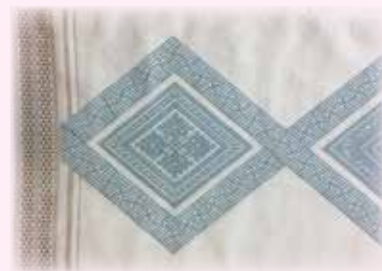
テーブルセンター (部分)