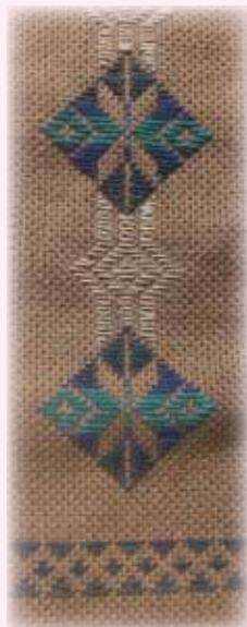
テーブルセンター (部分)